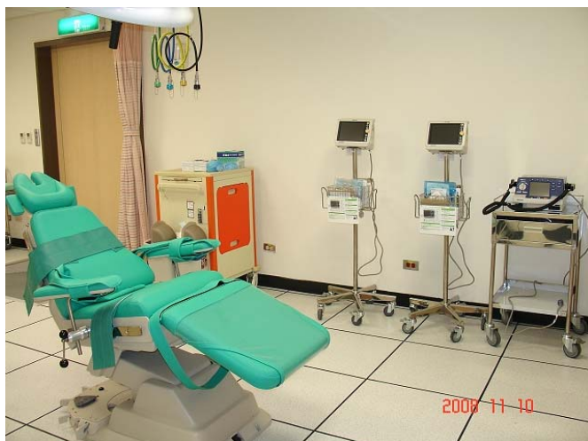
特別為身心障礙人士設置的診療椅，上面設有約束帶