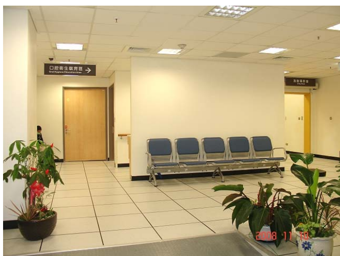
特殊需求者口腔照護中心空間寬敞，設有完善的無障礙空間